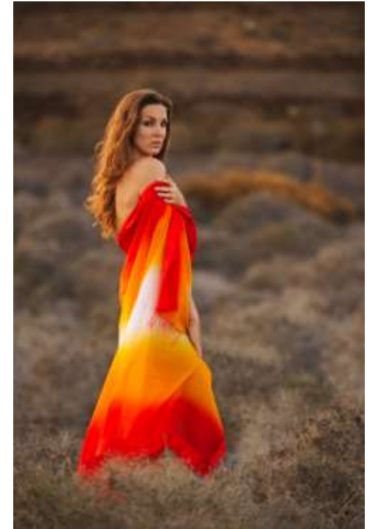
150mm, f / 2.8 (A/Blendenvorwahl), 1/125s (+VR), ISO200 Nachträglich -1 EV