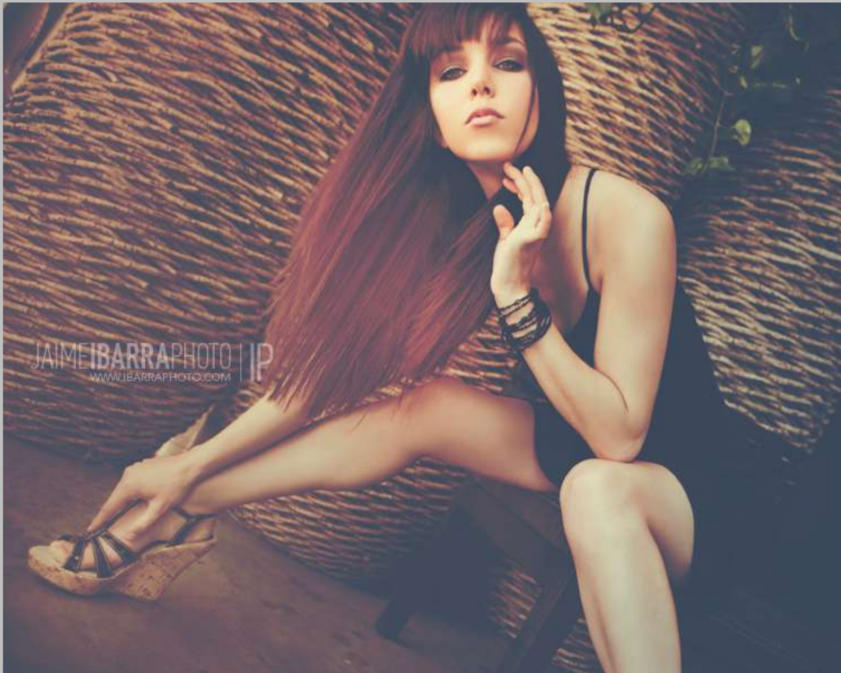
© Jaime Ibarra, used with permission